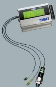
MSR 255 mit ext. Sensoren